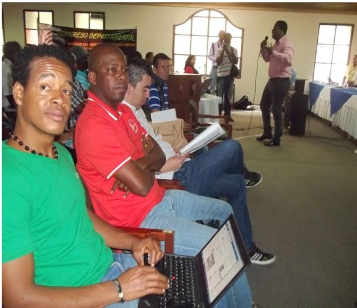
Foto 8. Consulta previa y consentimiento previo, libre e informado.