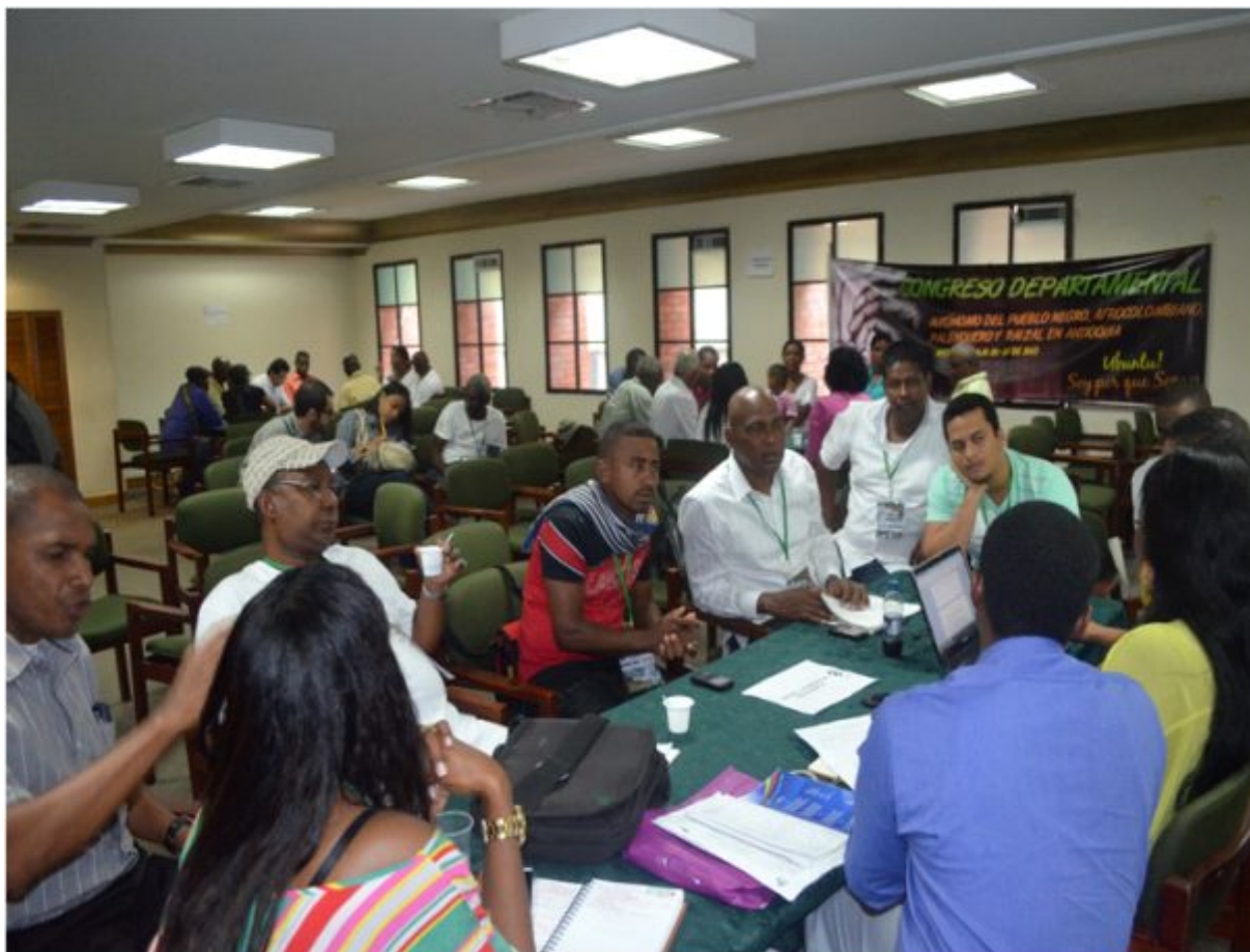
Foto 12. Congreso departamental de Antioquia.