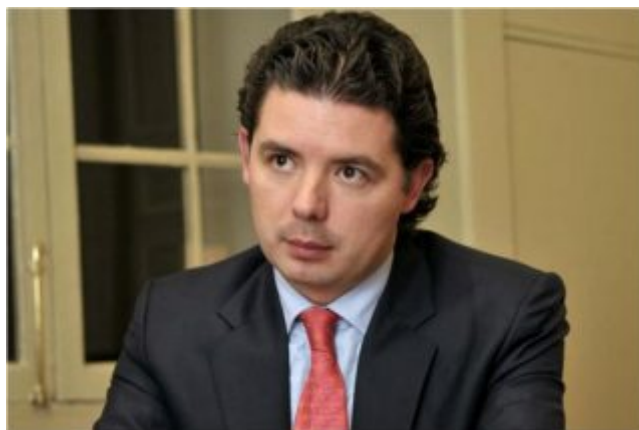
Aníbal Fernández, viceministro del Interior para la participación.

Según el viceministro del Interior, se apelará a la Asamblea de Consejos Comunitarios para destrabar la consulta del Estatuto de Desarrollo Rural, el Código Minero y la reforma a las CAR con las negritudes.