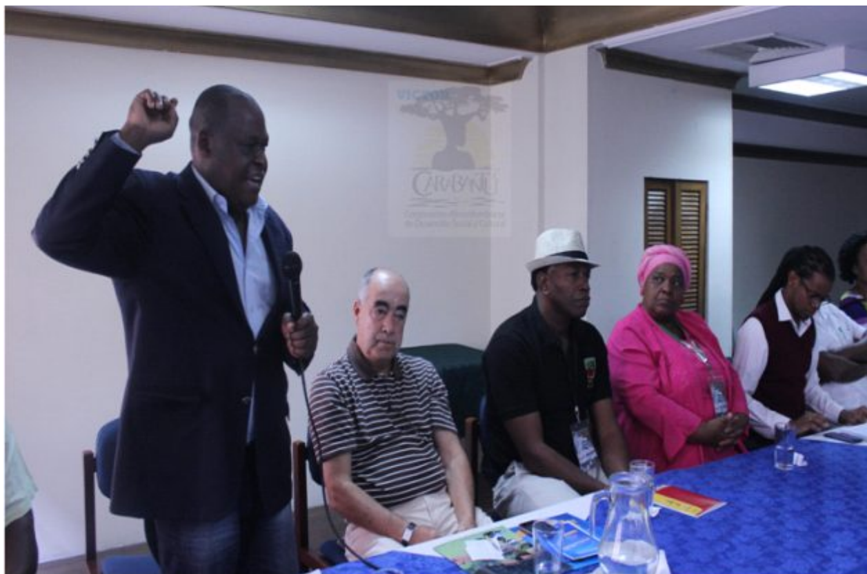
Foto 3. Congreso Departamental de Antioquia, foto. Antonio Sánchez 2013.

Estas conclusiones se incorporarán al Proyecto de Decreto a través de mesas de trabajo técnico sobre los temas de la reglamentación y los espacios de trabajo macro-zonales, en los cuales se ajustará y concertará con el Gobierno el mismo.