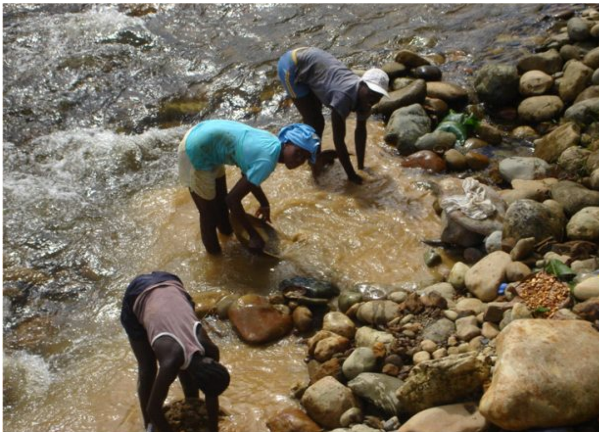
Foto 4. Visita a Santa María de Timbiquí, Cauca, 2008.