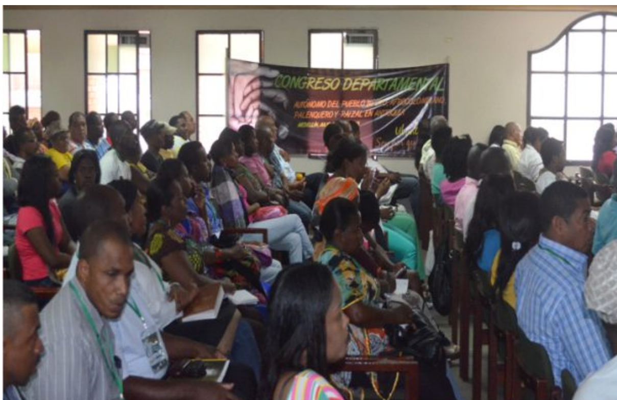
Foto 9. Congreso departamental de Antioquia, preparatorio al Congreso Nacional Afrocolombiano.

Kuchá... Suto ma prieto a ten kunké! Di black man gat widwat!