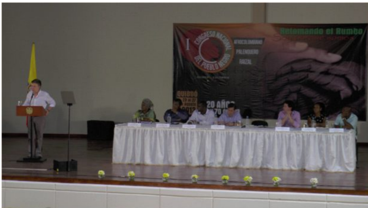
Foto 6. Conclusiones de la mesa de reglamentación del capítulo vii de la Ley 70 de 1993 - desarrollo económico y social.