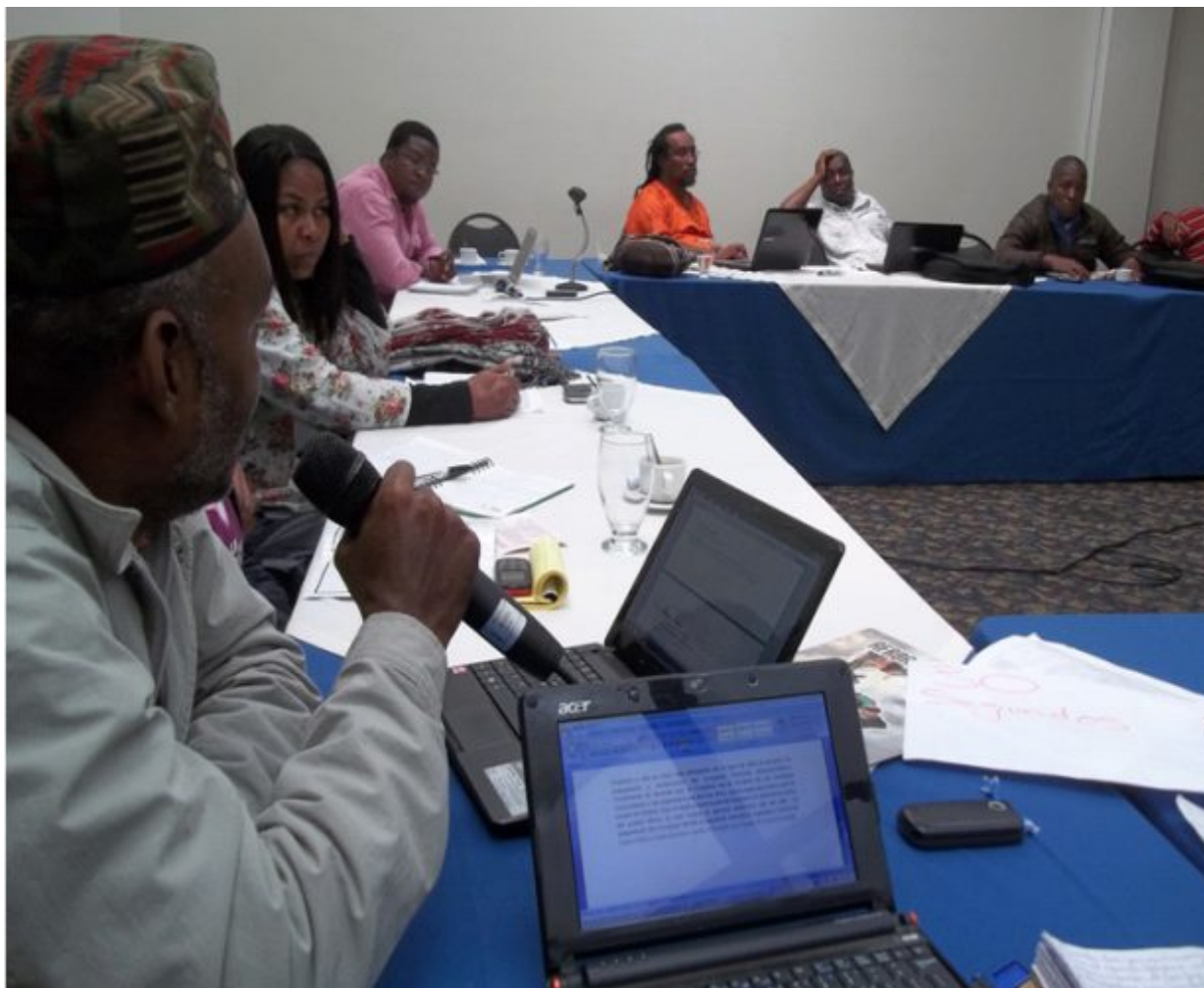
Foto 10. Reunión del Comité Político, preparatorio del Congreso Nacional Afrocolombiano.