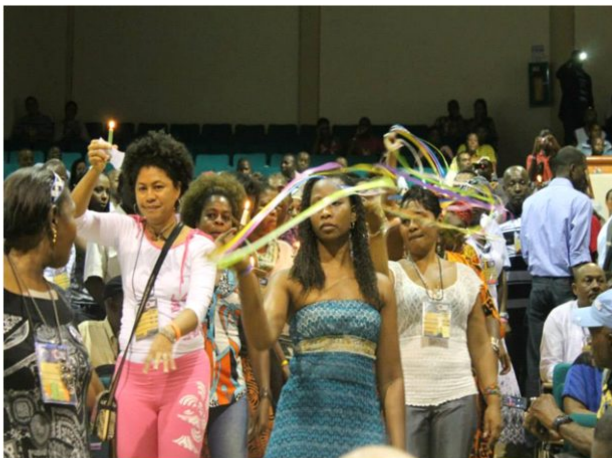
Foto 5. Acto espiritual liderado por las organizaciones de mujeres asistentes al Congreso Afro.

* Institucionalizar el Congreso Nacional de Comunidades Negras, Afrocolombianas, Palenqueras y Raizales, en reivindicación de sus derechos.