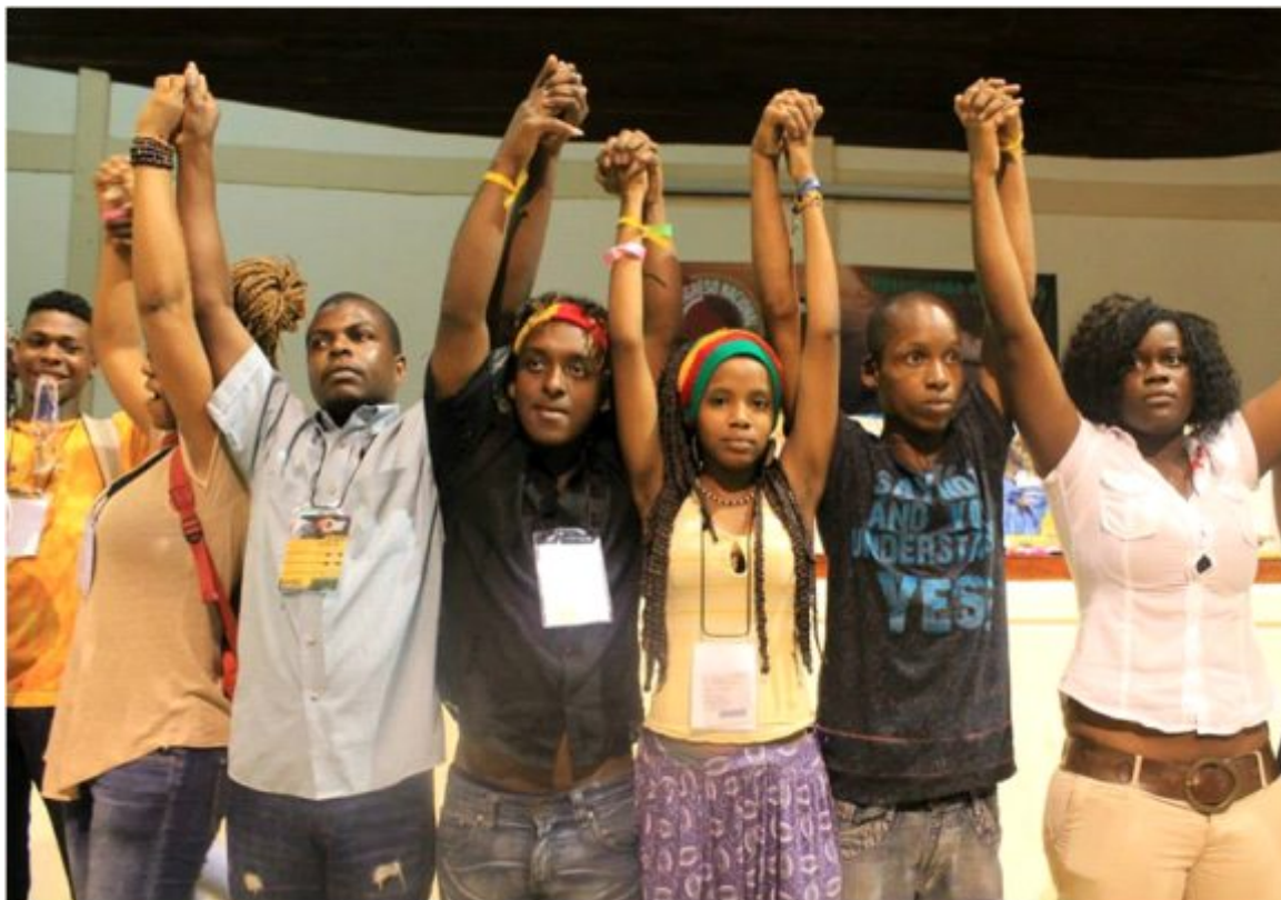
Foto 15.