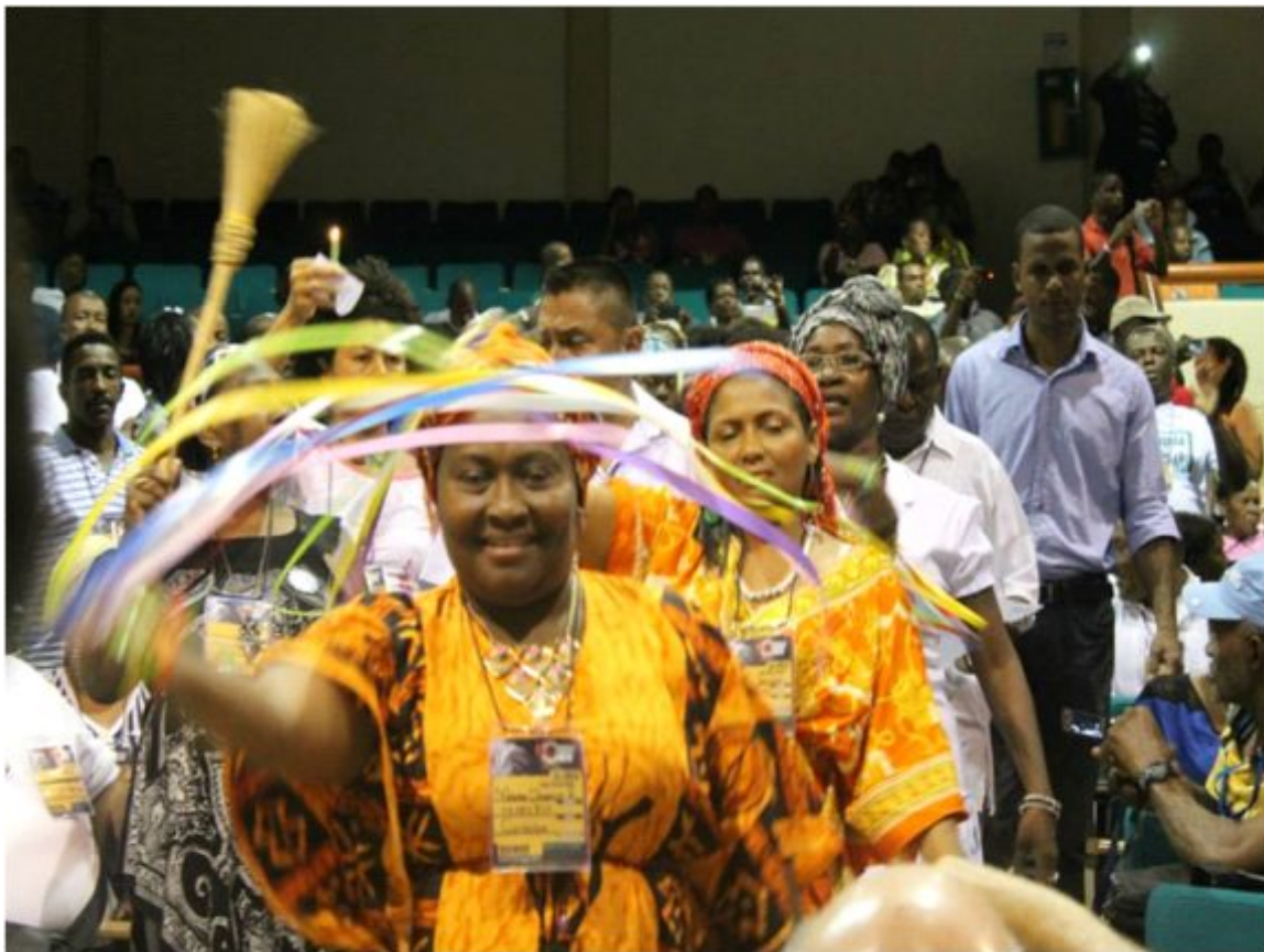
Foto 14. Mesa de trabajo sobre la perspectiva de mujer y género en el marco del Congreso Nacional Autónomo del pueblo negro, afrocolombiano, palenquero y raizal

“Por el derecho a la diferencia y proyectos de vida libres de violencia, discriminación y racismo