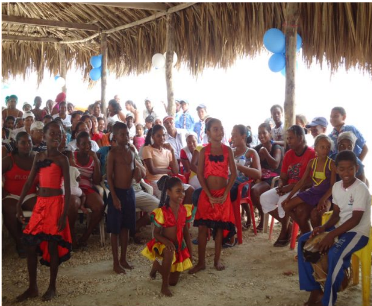
Foto 7. Proceso de Titulación Colectiva Consejo Comunitario de la Boquilla, Marlinda y Villa Gloria.