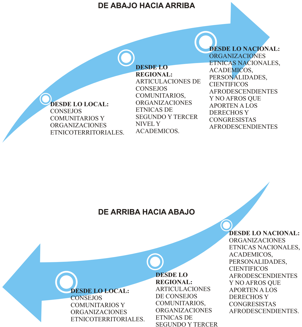
Ilustración 1. Esquema de consenso entre los pueblos, las comunidades negras, afrocolombianas, palenqueras y raizales. Procesos de participación, interlocución y consultas.