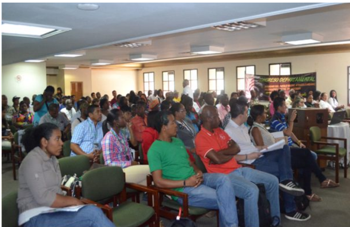
Foto 16. Congreso Departamental de Antioquia preparatorio al Congreso Nacional Afrocolombiano.