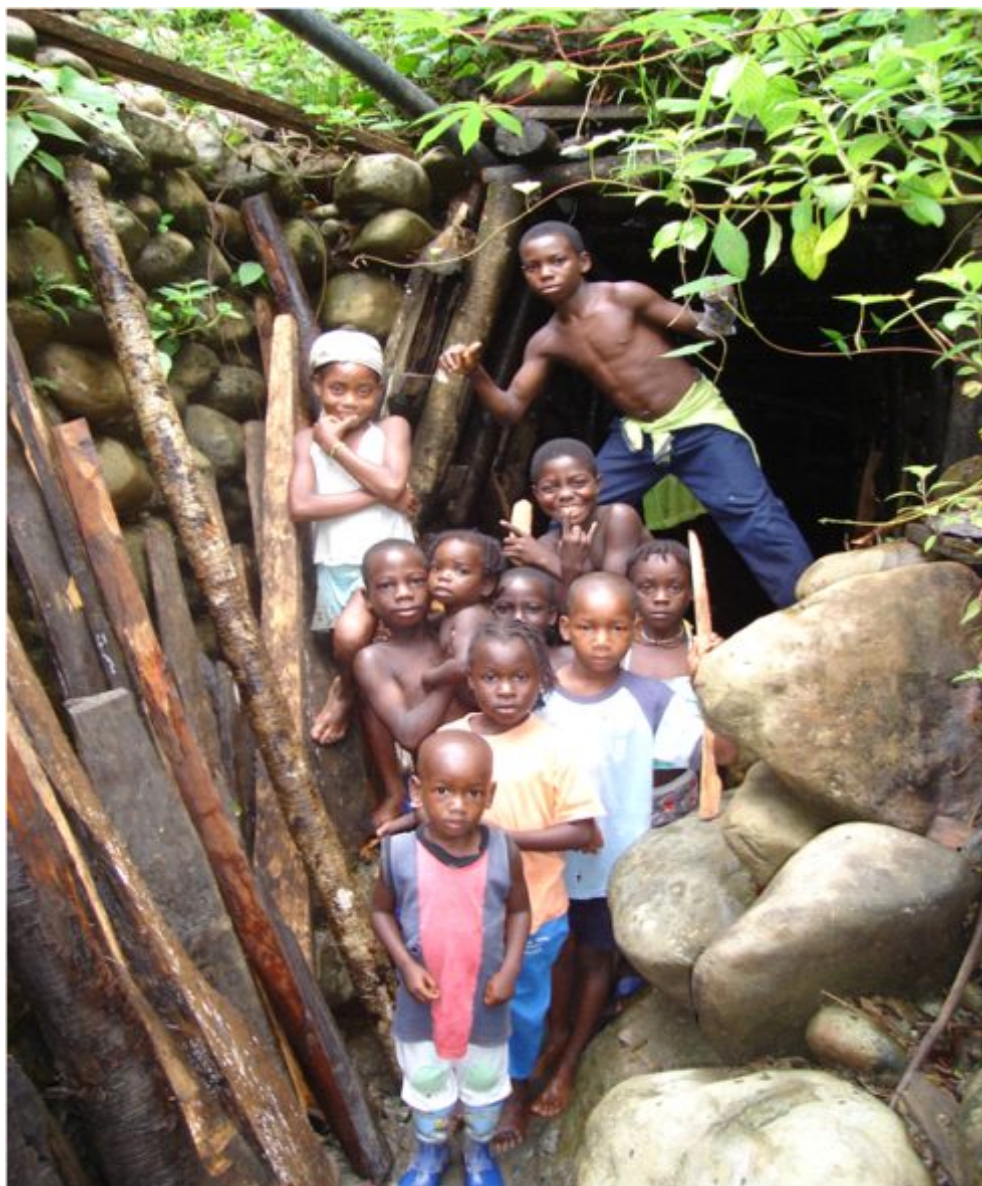
Foto 2. Niños en entrada de mina de oro, socavón en Santa María de Timbiquí, Cauca.